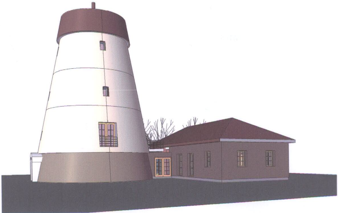
3D View 4