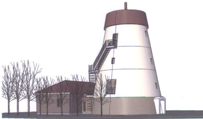
3D View 2